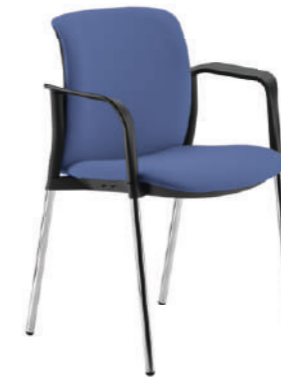
LK13-LK23 Sedia fissa con braccioli. Fixed armchair.