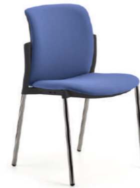
LK10-LK20 Sedia fissa. Fixed chair.

Struttura: in tubo di acciaio cromato. Structure in steel tube chromed.