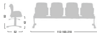
Panca a 2-3-4 posti. 2-3-4 bench.