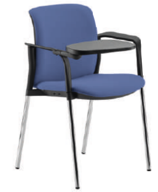
LK16 Sedia fissa con un bracciolo e scrittoio. Fixed chair with armrest and writing board.