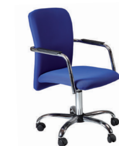
KLUB COMMUNITY CHAIR