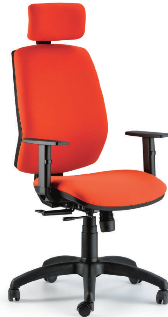
QUID OPERATIVE CHAIR