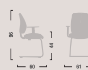
QD24 Sedia fissa con braccioli. Fixed armchair.