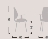
QD26 Sedia fissa con braccioli. Fixed armchair.