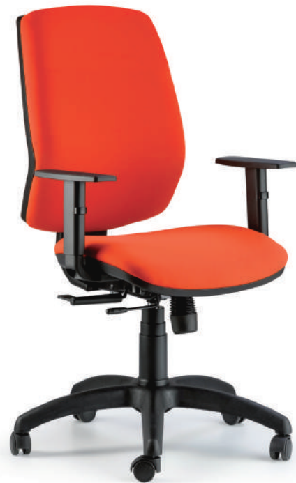
QUID OPERATIVE CHAIR