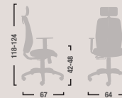
QD20 Poltrona ergonomica alta braccioli regolabili e oscillante mov.4. High ergonomic armchair adjustable with mov.4.