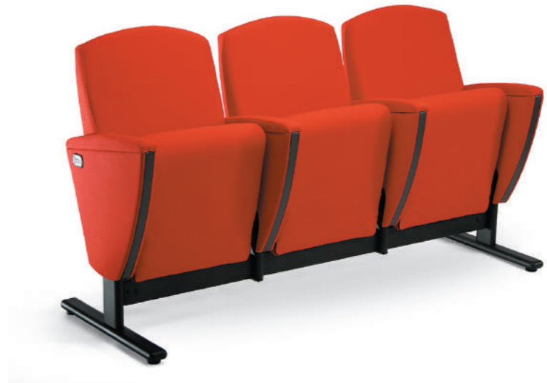
AURA WAITING CHAIR